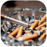
Đầu lọc thuốc lá