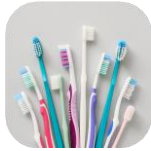
Bàn chải đánh răng