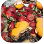
Nhóm thức ăn, thực phẩm thừa