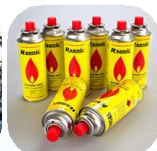
Bình gas mini