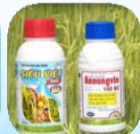
Bao bì thuốc bảo vệ thực vật