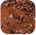
Bã cà phê