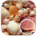
Vỏ hải sản