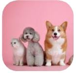
Phân động vật